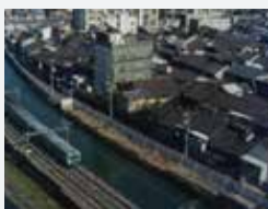
五条大橋南側から(京阪本線地下化前、昭和63年頃)

鴨川運河は、三条通で暗きよ(地下水路)となり、塩小路橋から再びその流れが姿を現します。暗きよ化の工事は、京阪本線の地下化に伴い昭和63(1988)年に行われたもので、せせらぎの道はそれに伴う川端通の整備・拡張事業の一環として誕生しました。